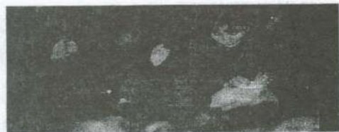
Sonia Escudero, enviada desde el Hospital Aeronautico Central al hospital reubicable de Comodoro Rivadavia