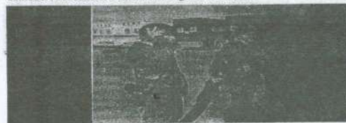
Stella Morales y Gisela Bassler, en las afueras del hospital reubicable instalado en Comodoro Rivadavia