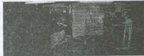
Enfermeras, en la sala de terapia intensiva del hospital reubicable de Comodoro Rivadavia