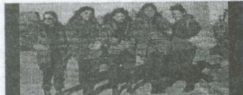
Enfermeras del Ejército embarcadas en el buque hospital Almitante Iriza